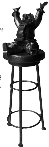
Lohn aller Mühen: Der „Oelsnitzer Barhocker“, unser begehrter Kabarettpreis.